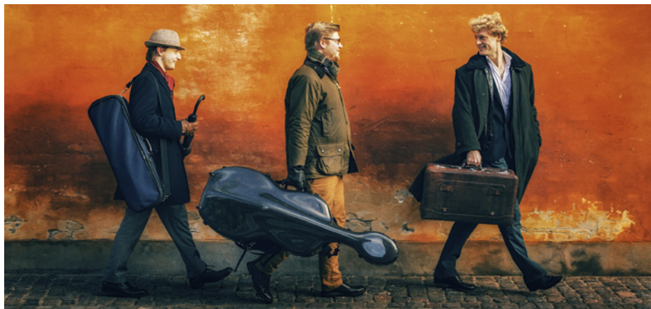
Trio Vitruvi, vinder af P2 Kammermusikkonkurrence 2014, får deres debut i Carnegie Hall i 2018.